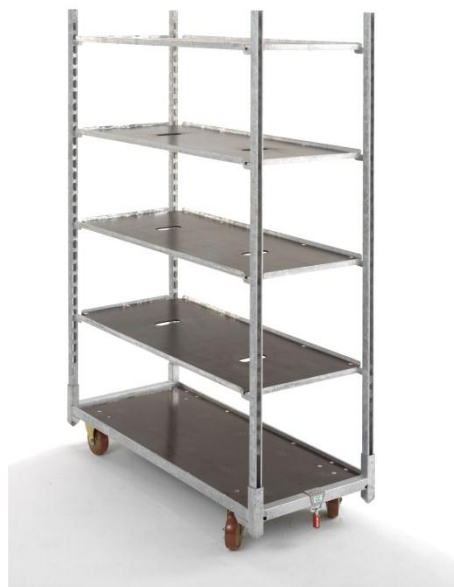
Den originale CC Container